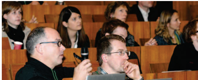
Schram-Symposium 2009, Göttingen

niz-Instituten gefördert. Wie korreliert das Zusammenwirken von Neuronen mit einem bestimmten Verhalten? Wie werden chemische Prozesse in Lern- und Gedächtnisinhalte übersetzt? Dies sind nur zwei wesentliche Forschungsfragen, denen sich die Wissenschaftler in ihren Teams widmen.